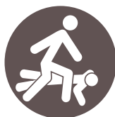
ACCIDENTS DE PERSONNES