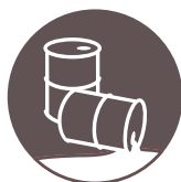
POLLUTIONS (EAUX ET SOLS)