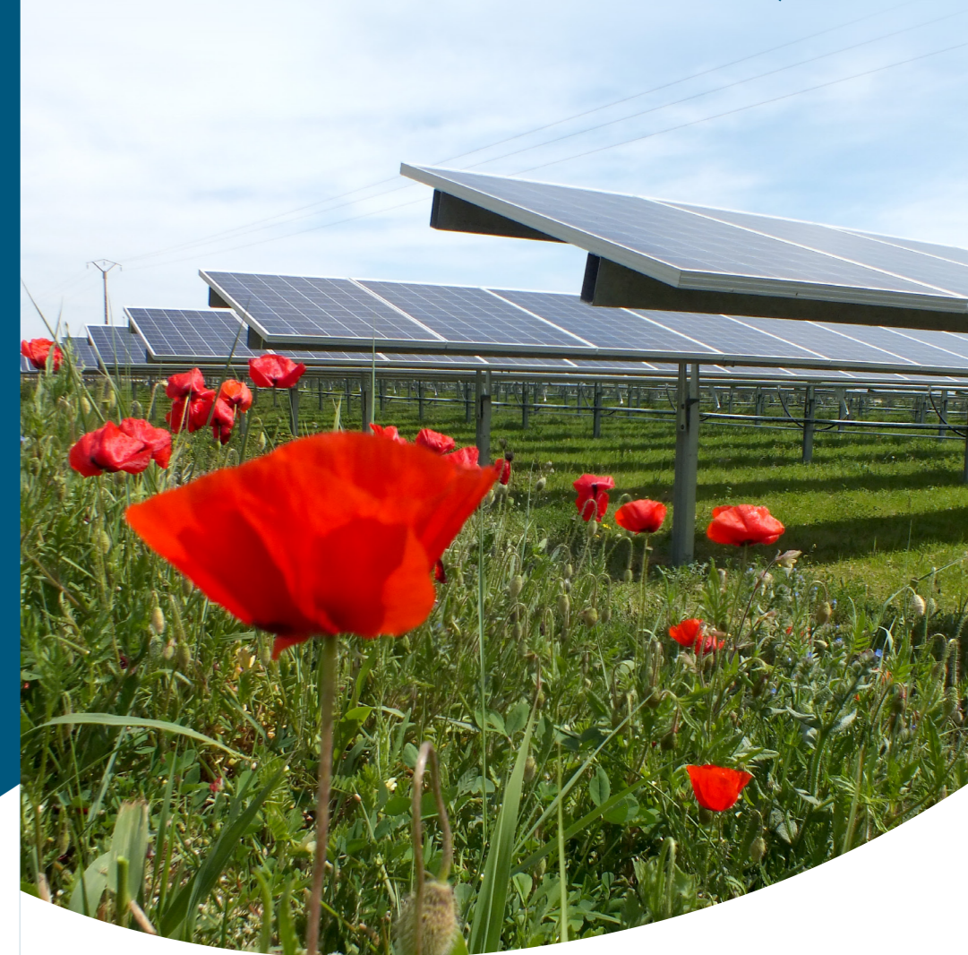
Graphistar 11/2017 - Crédit photos : Camille Moirenc, photothèque CNR, imprimé sur papier recyclé.