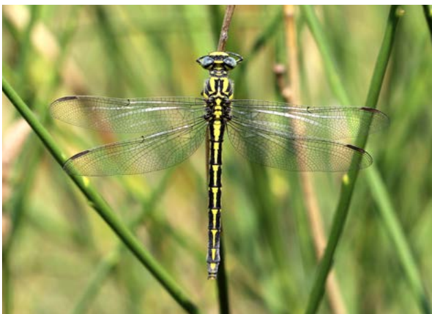
Gomphus graslinii

CNR a soutenu plusieurs actions, notamment de la prospection sur une partie de son domaine d'intervention, des expertises sur la franchissabilité des barrages et la publication d'un bulletin de liaison.