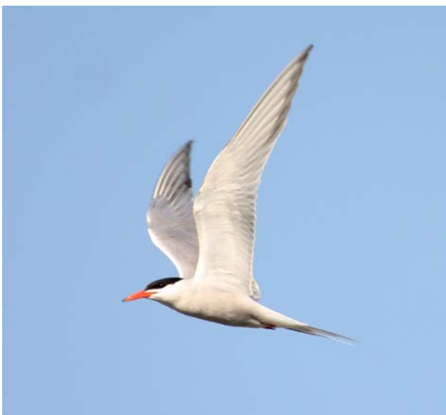
Sterne pierregarin

Des inventaires ont été ciblés dans le secteur du bord du Rhône pour rechercher en priorité : Gomphus graslinii , G. flavipes , Oxygastra curtisii , Coenagrion mercuriale , Symptetrum depressiusculum .