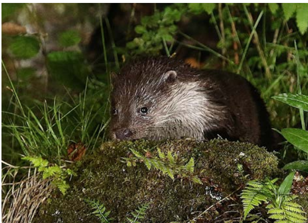
Loutre d'Europe